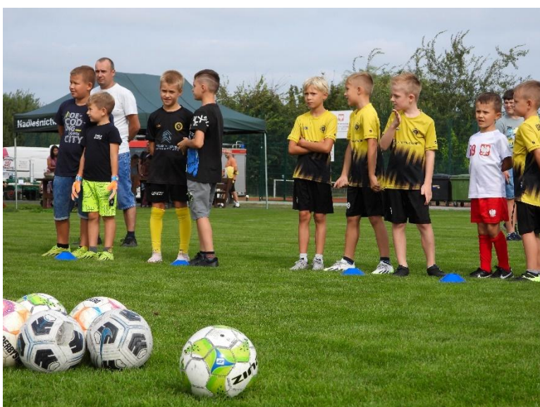
GKS Iskra Prosna Sieroszewice „Festyn sportowo rekreacyjny – Łączy nas piłka”

W ramach otwartego konkursu ofert dla organizacji pozarządowych w 2024 roku gmina Sieroszewice współfinansowała zadania w sferach: kultury, sztuki, ochrony dóbr kultury i dziedzictwa narodowego, wspierania i upowszechniania kultury fizycznej, działalności na rzecz osób niepełnosprawnych, działalności na rzecz osób w wieku emerytalnym, turystyki i krajoznawstwa, ekologii i ochrony zwierząt oraz ochrony dziedzictwa przyrodniczego. Dzięki wsparciu z budżetu gminy zrealizowano m.in.: