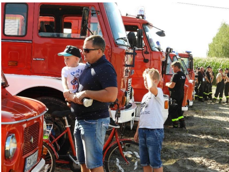
Stowarzyszenie „Ogniste Serca” „Zlot pojazdów pożarniczych”