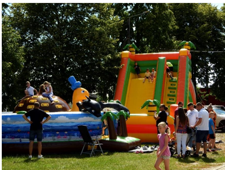
Koło Gospodyń Wiejskich Rososzycy „Festyn rodzinny w Rososzycy”