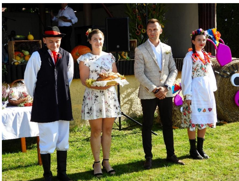
Stowarzyszenie „Aktywny Strzyżew” „Plon niesiemy plon”