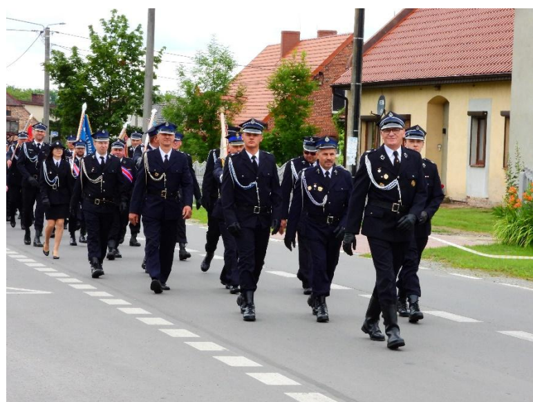
Ochotnicza Straż Pożarna Latowice „Obchody Gminnego Dnia Strażaka połączone z 95-leciem OSP Latowice”